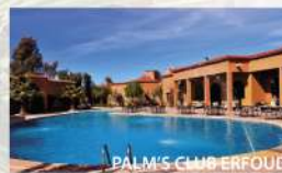
PALM'S CLUB ERFOD