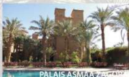
PALAIS ASMAA ZAGORA