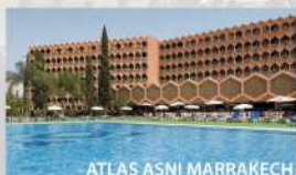
ATLAS ASNI MARRAKECH