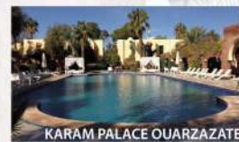
KARAM PALACE OUARZAZATE